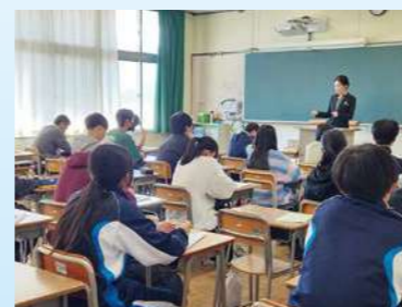
キャリア教育「ようこそ先輩」

年間を通して、放課後セミナーを開講しています。また、個々の進路希望に応じて小論文・面接指導などのきめ細かい指導を行っています。